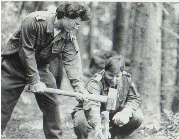
Die Männer der ZSO Kilchberg mussten recht ungewohnte Arbeit verrichten. Doch sie leisteten diese mit Freude und grossem Einsatz.