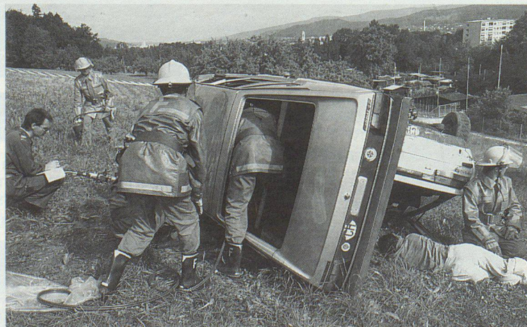
Ein spektakulärer Verkehrsunfall mit mehreren Verletzten erforderte rasches und richtiges Handeln.