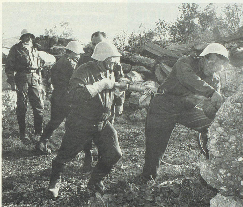
SBG-Betriebsschutzangehörige auf dem Übungsgelände Leutschenbach im Einsatz.