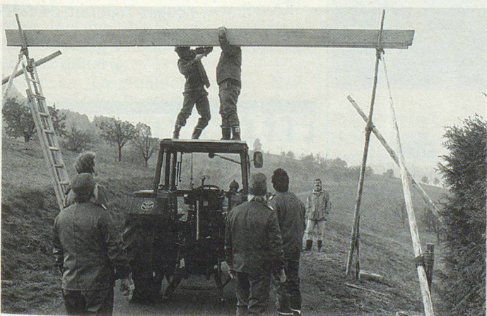
Die Überwindung von Hindernissen wurde als Herausforderung betrachtet.

wurde dem Zufall überlassen. Auch auf die Bereitstellung der Mannschaftsverpflegung wurde das Augenmerk gerichtet, gilt doch im Zivilschutz wie überall die Maxime: «Ohne Fourrage keine Courage.»