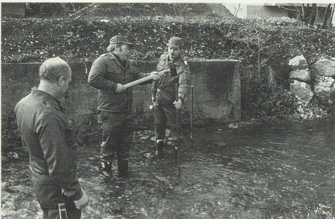
Nässe und Kälte setzten den Zivilschützern ganz schön zu.