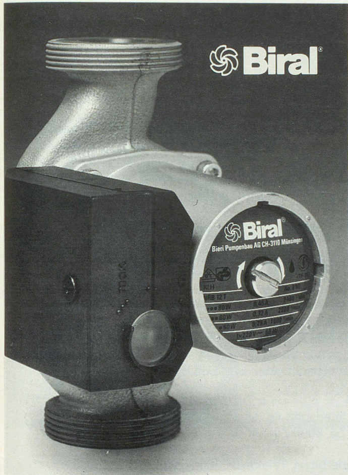
Eine der kleinsten Umwälzpumpen von Biral – bereits seit Jahren SEV-geprüft.