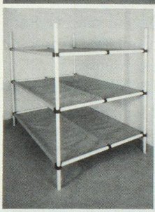
Dreier- und Sechserliegen

Kellergestell in Friedenszeiten. Bequeme Liegestelle im Katastrophenfall, dank integrierter Tuchliegende ist KEINE MATRATZE notwendig.