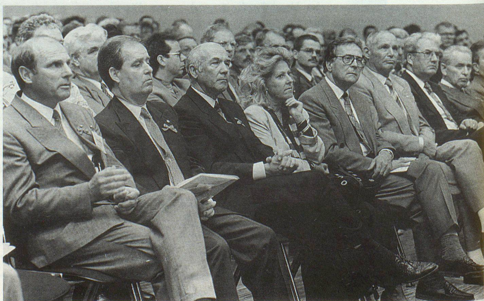
Voller Saal mit Besuchern aus der ganzen Schweiz an der Eröffnungsveranstaltung.

Eine wichtige Funktion übernahm der Zivilschutz beim Freiwilligeneinsatz. «Ohne