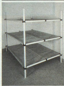
Dreier- und Sechserliegen

Kellergestell in Friedenszeiten. Bequeme Liegestelle im Katastrophenfall, dank integrierter Tuchliegende ist KEINE MATRATZE notwendig.