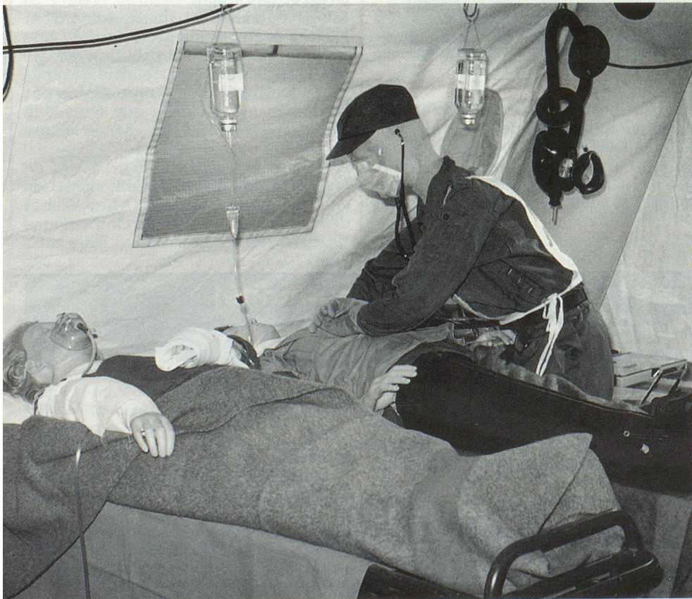
Présentation, à l'aide de mannequins, du matériel et des premiers soins aux blessés.

Une autre partie était consacrée aux différents partenaires de la protection civile; d'autres panneaux explicatifs signalaient les innovations prévues dans l'organisation de la PCi genevoise qui se veut, selon Claude Haegi: «Rajeunie, efficace, prête à intervenir plus rapidement, moins coûteuse. La protection civile de demain répondra ainsi aux besoins vitaux de la population face aux risques générés par notre société.» ▣