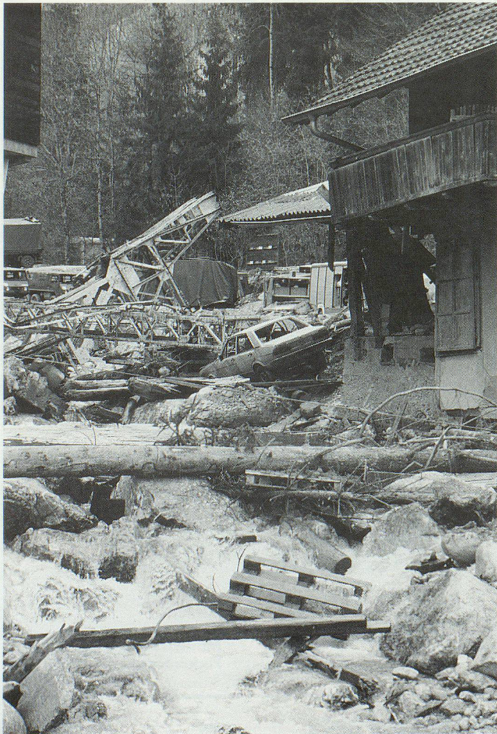
Wirklichkeitsgetreue Schadenlage in Därstetten.

Die Fotos vermögen mehr auszudrücken als Worte: Unter den kritischen, von Minute zu Minute respektvolleren Blicken der vielen Zaungäste wurden Eingeschlossene aus einem Auto im Flussbett befreit, Personen von der Feuerwehr aus dem zweiten Stock eines Holzhauses geborgen, mit Baggern Steine aus dem Fluss gehoben, mit Schneidbrennern die Stahlträger eines umgestürzten Krans entzweigeschnitten, angeschwemmtes Holz aus dem Bach gezogen, Verletzte behandelt und abtrans-