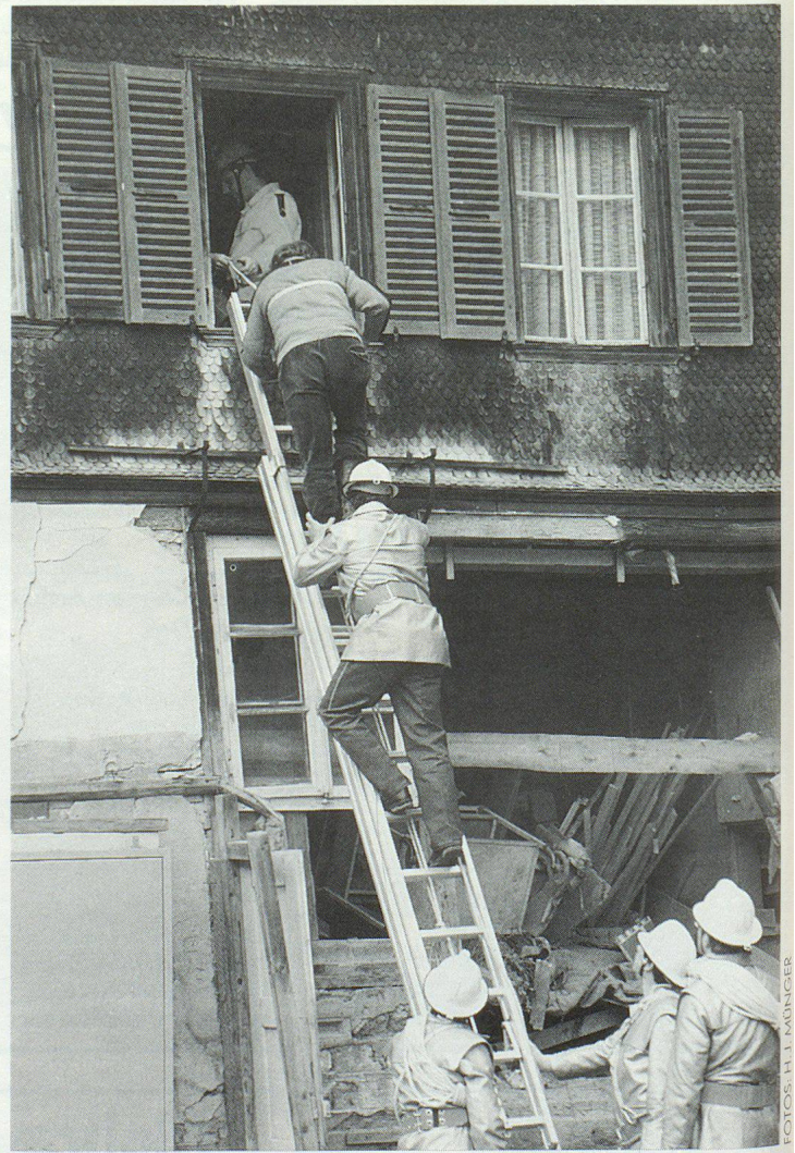
Wichtiger Verbundpartner ist auch die Feuerwehr.