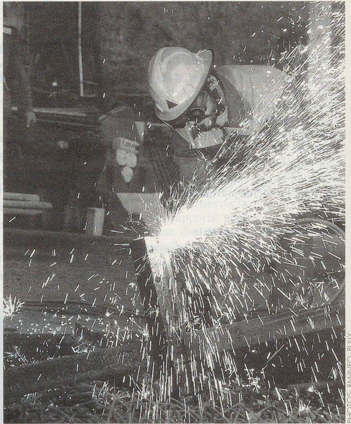
On s'exerce au chalumeau découpeur.

Pour la section d'intervention rapide de Montreux-Veytaux, c'est la première fois que celle-ci intervient de nuit. Même si le chef de section connaissait l'endroit de l'exercice, il ignorait en revanche ce qui al-