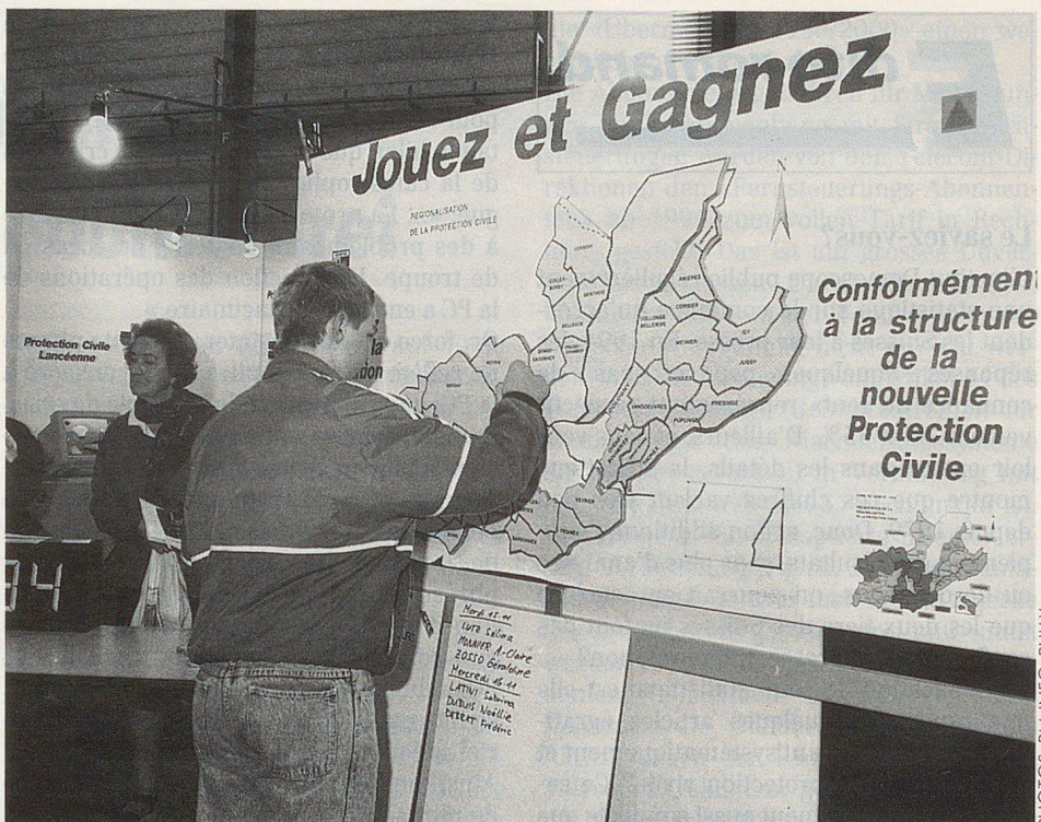
Un jeune visiteur reconstitue le puzzle des groupements des communes genevoises.

Il est vrai qu'à Lancy, l'état-major est totalement opérationnel; il dispose de constructions et des abris nécessaires à la mise en sécurité de sa population. Pourtant, la commune a décidé d'appliquer dans son ensemble un concept de sécurité. Cette sécurité civile lancéenne existe bel et bien, puisqu'un accord réglant toutes les modalités de qui fait quoi et commande quoi a été signé en mai dans une convention. Cette convention unit les sapeurs-