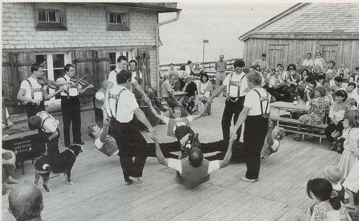
«Stobete» auf der Hochalp mit «Mölrada» und Streichmusik.