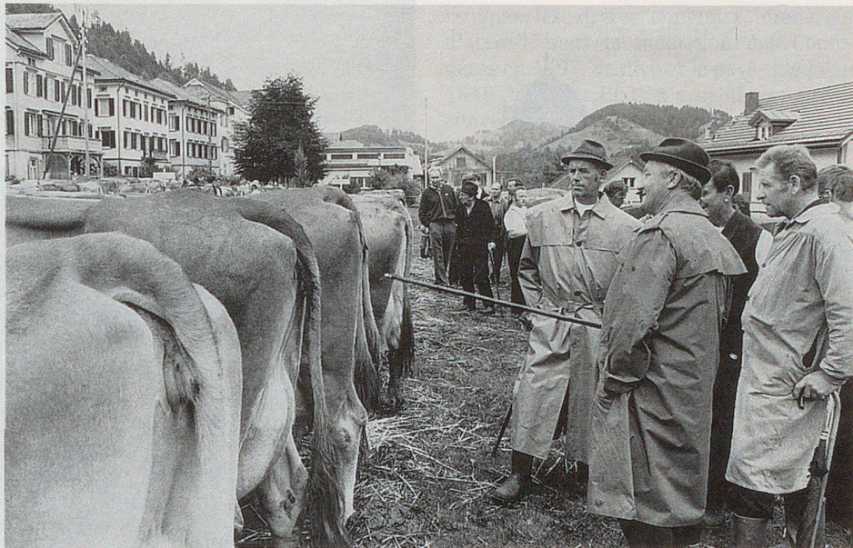
Die Viehschau in Urnäsch zeugt von einem gesunden Bauernstand.

Um manche Heiler ranken sich geradezu wundersame Geschichten. Eine Erzählung, die allerdings schon rund 50 Jahre zurückliegt, möge dies aufzeigen: In Teufen lebte ein Doktor Schnider, der angeblich wahre Wunder wirkte. Er behandelte alle Leute, ob arm oder reich. Wenn ein Patient ihm klagte, er habe kein Geld, verzichtete er grosszügig auf das Honorar. Aber wehe, wenn der Patient ihn angelogen hatte. Wollte er in Teufen wieder die Bahn besteigen, blieb er wie angewurzelt stehen und konnte keinen Schritt mehr vorwärts tun. Die Bahnbediensteten wussten Bescheid und schickten ihn zu Doktor Schnider zurück, um die Rechnung zu bezahlen. Ob die Geschichte wahr ist, lässt