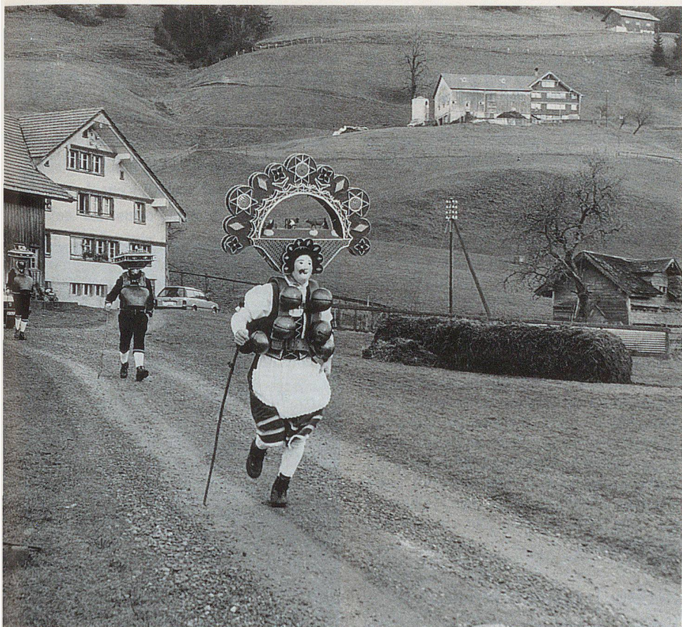
Les «Silvesterkläuse» au vieux Saint-Sylvestre (13 janvier), au-dessus d'Urnäsch.

va sa fin en 1408, lors d'une défaite près de Bregenz. C'est alors que les Appenzellois se rapprochèrent des Confédérés. En 1411, un pacte fut signé avec sept des huit vieux cantons, seul Berne ne voulut pas y participer. Les Confédérés hésitèrent longtemps à accepter les Appenzellois récalcitrants comme membres ayant les mêmes droits dans leur alliance. En 1452 on leur accorda néanmoins le statut de «canton affilié», et en 1513 ils furent accueillis, comme récompense pour leur fidélité en-