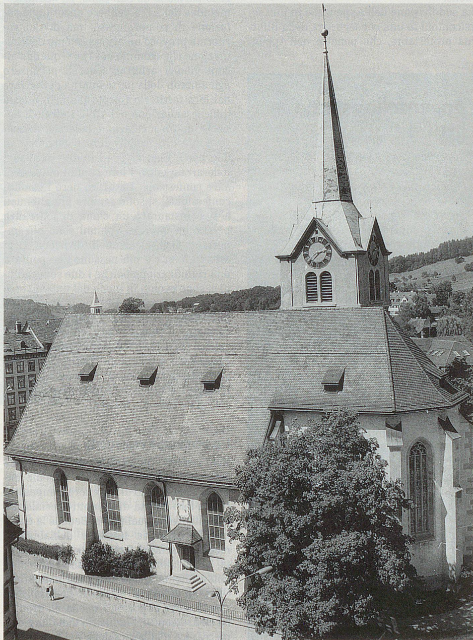
La chiesa protestante di Herisau.

Per comprendere meglio le peculiarità di un cantone bisogna conoscerne la storia. Ciò vale in modo particolare per l'Appenzello, che è suddiviso nei due semicantoni di Appenzello interno ed esterno. Anticamente le cose stavano diversamente. Fino al Medioevo la regione dell'Appenzello era coperta da imponenti foreste. Quando i Romani occuparono l'Elvezia evitarono però di occuparsi di questa regione. In ogni caso nella regione appenzellese non esiste alcun ritrovamento dell'epoca romana. Furono gli Alemanni provenienti dalla Svizzera settentrionale che nel 4° secolo penetrarono nel territorio e lo resero gradatamente coltivabile. Le testimonianze menzionano il borgo di Schwänberg presso Herisau nell'anno 821, la chiesa di Herisau