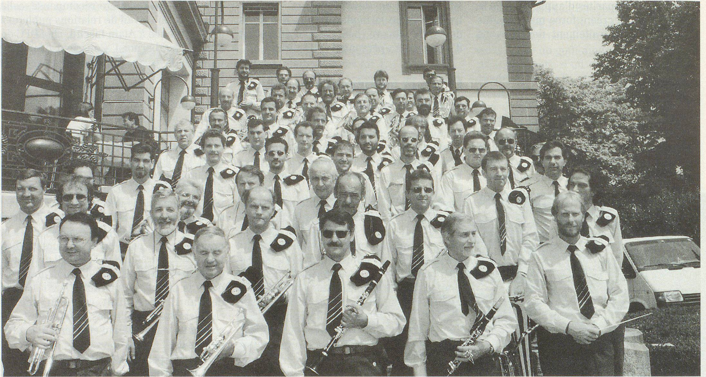
La fanfare de la PCI cantonale vaudoise a agrémenté l'apéritif.