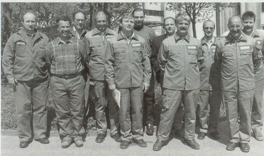
Die gut motivierten Zivilschützer vor dem Ausrücken zur Arbeit.

An den beiden Einrückungsorten bei der BSA beim Werkhof und bei der Zivilschutzanlage im Schulhaus Hinterbüel waren die vielen gleichgekleideten Männer unübersehbar. Ihre Arbeitskleider hatten sie be-