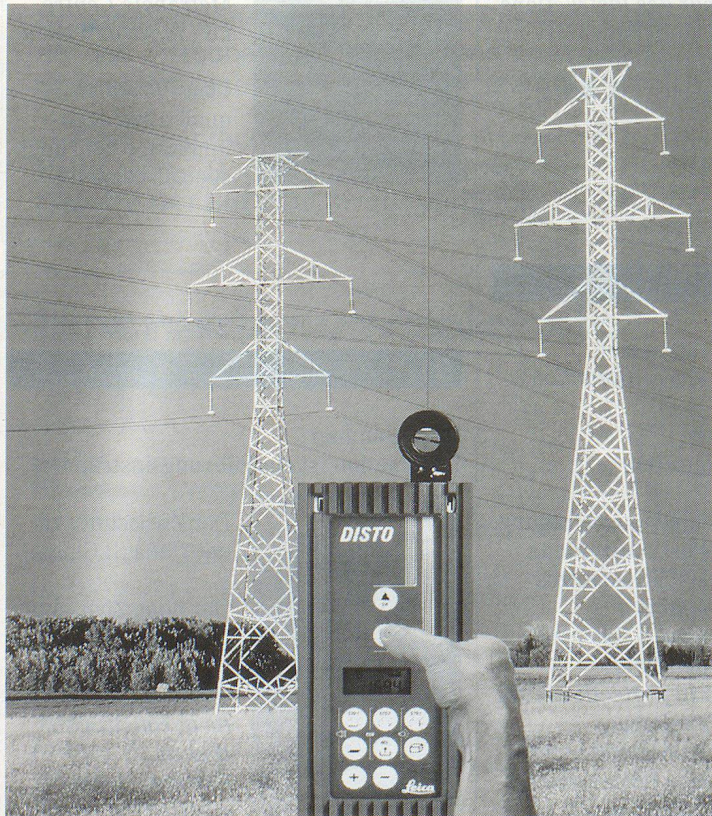
Leica Power DISTO bei der Höhenbestimmung von Starkstromleitungen.

berührungslos eingemessen werden. Die Messbarkeit auf diffus reflektierende Oberflächen wie Ziegelsteine, Holz oder Steinstrukturen wurde deutlich verbessert. Die Messzeiten wurden ebenso bis zu 40% bei optimalen Bedingungen reduziert.