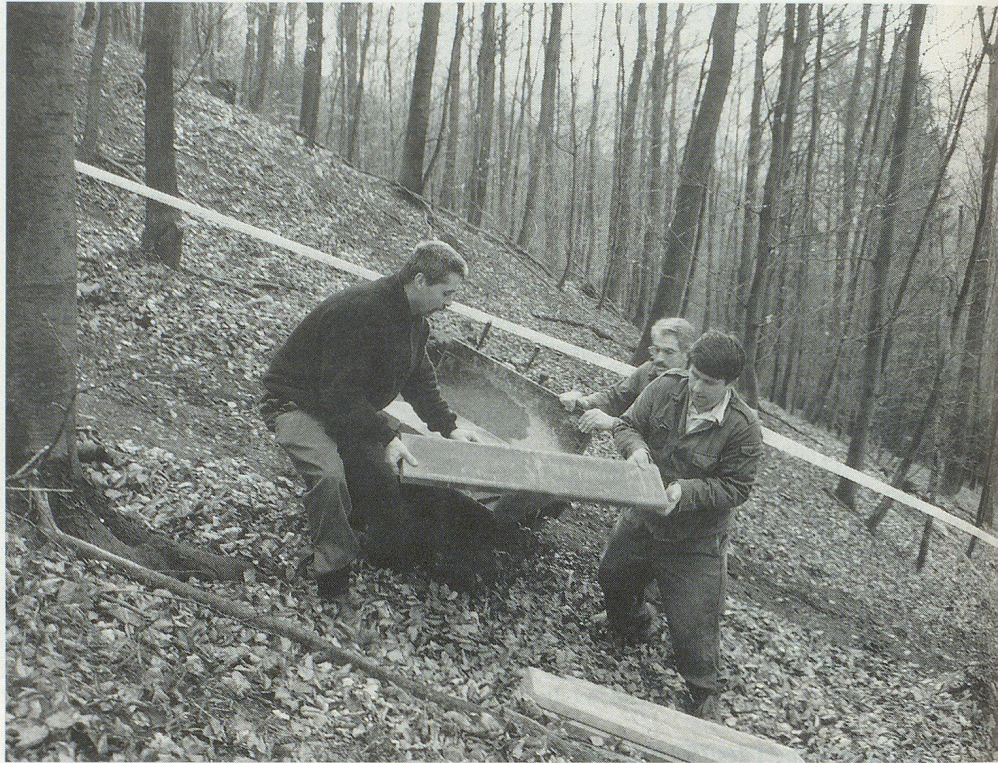
Die Arbeit im steilen Gelände war zwar streng, aber faszinierend.