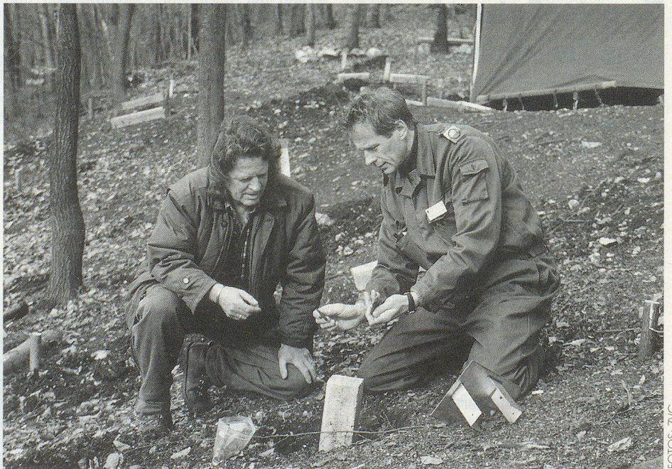
Während den Arbeiten wurden immer wieder urzeitliche Gegenstände entdeckt.

trieben, sich Schweine, Schafe und Ziegen hielten und sich von Fleisch, Milch und Brot ernährten.