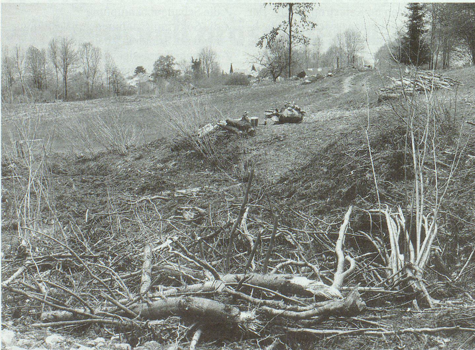
Schutt, Geröll und Holz ist in Fliela, Gemeinde Oberried am Brienersee, auf der Weide liegengelassen.