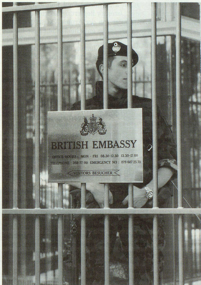
Bewachungsdienst hinter den Gittern der britischen Botschaft.

polizei Bern übergeben. Diese beantragte dann über den Kanton beim Bund einen subsidiären Sicherungseinsatz von Militäreinheiten. «Die Zusammenarbeit zwischen Polizei und Militär klappt vorzüglich, es gibt kaum Abstimmungsprobleme», bestätigte der Sprecher der Stadtpolizei Bern. ▣