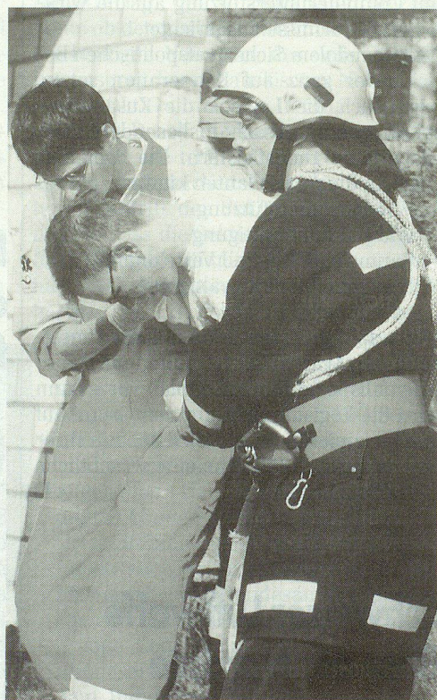
Die Feuerwehr löscht und hilft bei den Rettungen.

Ein heisser Tag für den Koordinierten Sanitätsdienst des Kantons Luzern