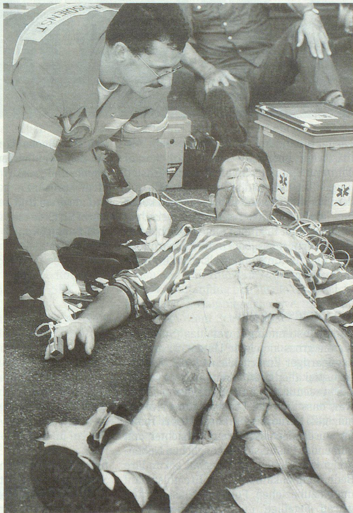
Ein Verletztennest wird eingerichtet. Rettungsdienst und Samariter haben alle Hände voll zu tun.