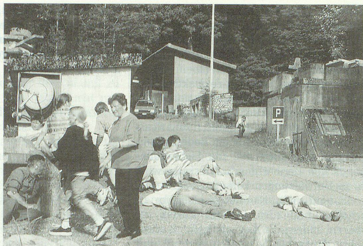
Eine gewaltige Detonation erschüttert das Wohnviertel. Verletzte wälzen sich am Boden oder irren im Schockzustand ziellos umher.