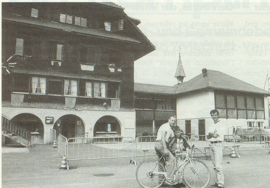
Als Durchgangslager ist das Berggasthaus Salwideli durchaus geeignet.

Luzerner Zivilschützer in der Flüchtlingsbetreuung