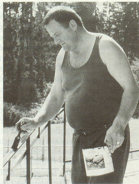
Die Asylanten wollen nicht untätig herum-sitzen. Auch um das Haus herum gibt es viel zu tun.

Für den Betrieb des Durchgangslagers, das für viele Asylsuchende Endstation sein könnte, kommt der Zivilschutz dank optimal strukturierter Organisation mit wenig Personal aus. Für die Leitung und den Betrieb des Lagers, mit eingerechnet Dolmetscherdienst, ärztlicher Dienst, schulische Betreuung, Beschäftigungsprogramm und sportliche Animation, stehen umgerechnet vier Vollzeitstellen zur Verfügung. Hinzu kommen jeweils acht Zivilschützer, die sich von Woche zu Woche in einem sich um einen Tag überlappenden Turnus von acht