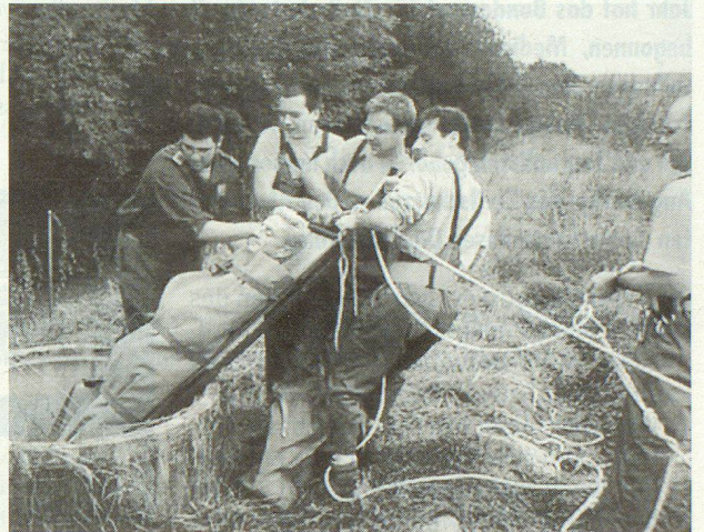
Grosses Aufatmen: Die Rettungsübung ist gelungen.