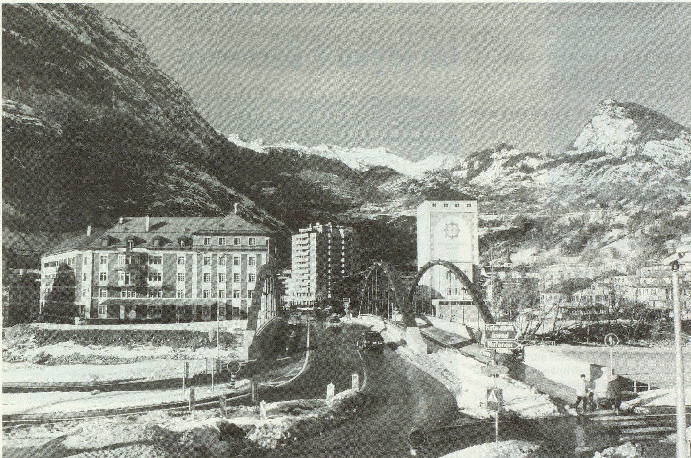
Die moderne Brücke über den Rotten.

vasso-Turm. Hierauf geht's durch den Klosiweg, und durch den Ornavassoweg erreichen wir die Sankt-Maurizius-Kirche. Hier, auf unserem Bummel durch die heimeligen Gassen und Strässchen des alten Naters, spüren wir den rauen, aber herzlichen Charakter von Naters und seiner Bewohner.