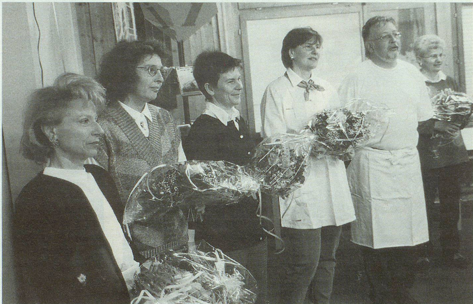
Die Pizza-Crew erhielt zum Dank für ihren Einsatz Blumen.

Planungsphase nicht einzelne Organisationen bereits mit einem Konzept festlegen. Im übrigen sei bei der Planung der Instrumente der Sicherheitspolitik die Polizei nicht zu vergessen. Diem betonte, dass der Zivilschutz mit einer neuen Struktur und