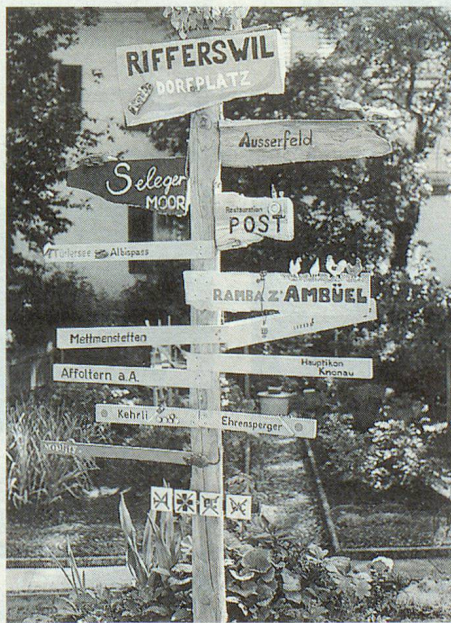
In Rifferswil sind sogar die Wegweiser anders.