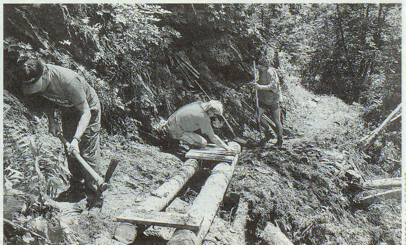
Stege wurden gebaut und Wanderwege wieder begehbar gemacht.