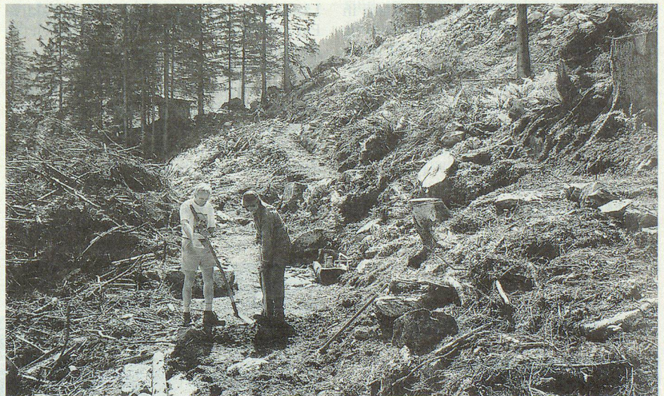
Chaos allenthalben. Die Zivilschützer mussten die Wege erst freilegen.

im Einsatz zur Behebung von Lawinenschäden. Es galt, Flurschäden zu beheben, Wander- und Höhenwege zu räumen und wieder begehbar zu machen sowie Alpweiden zu säubern. Die Arbeitsplätze lagen in 1200 bis 1800 Metern Höhe. Im steilen Gelände waren das schweisstreibende und zum Teil nicht ungefährliche Arbeiten. ms.