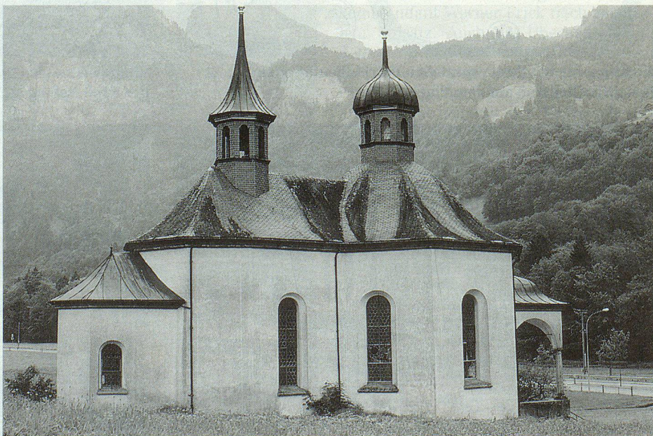
Die barocke Kapelle zum Heiligen Kreuz.