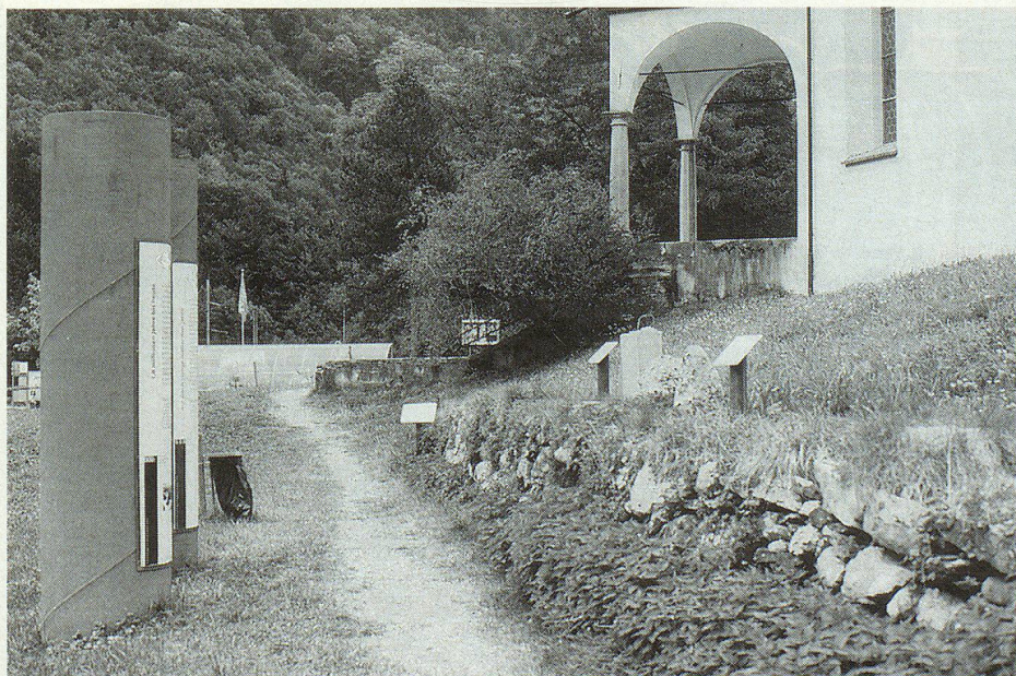
Eine Station des Erlebnisparcours «Stein und Wasser».

Ebenfalls in Wolfenschiessen, direkt an der Strasse, sticht «die Burg» ins Auge. Im 13. und 14. Jahrhundert war hier der Sitz der Edlen von Wolfenschiessen. 1962/63 wurden die Überreste restauriert und unter den Schutz der Eidgenossenschaft gestellt.