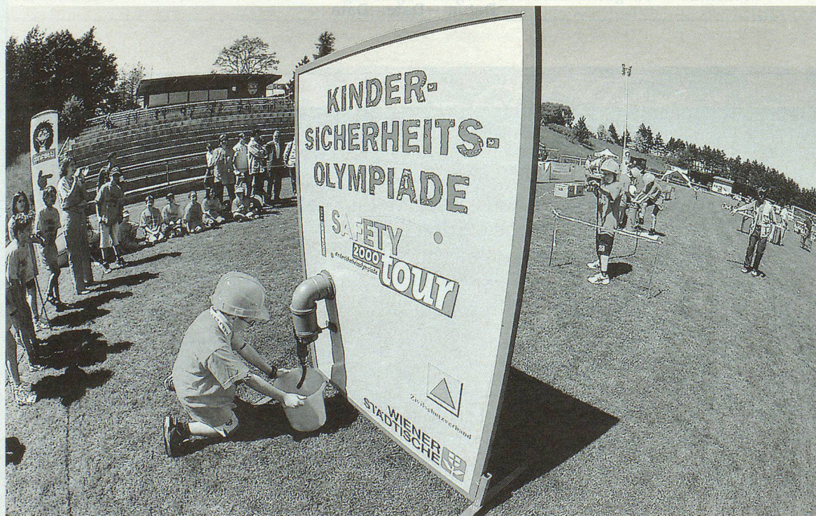
Spass, Spannung und Geschicklichkeit: Der Safety-Löschwettbewerb war eine der Knacknüsse.

Das Programm der Safety-Tour setzte sich aus vier spannenden Wettbewerben zusammen, in denen die Kids nicht nur ihr Sicherheitswissen, sondern auch ihre Geschicklichkeit unter Beweis stellen konnten. Beim Radfahrwettbewerb, dem Gefah-