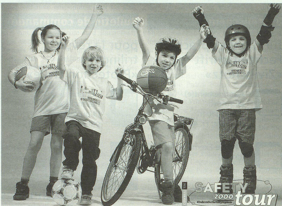
«Hurra, wir haben es geschafft. Und über Sicherheit wissen wir bestens Bescheid.»

«Es begann als Experiment und wurde zur grössten Veranstaltungsreihe in der Geschichte des österreichischen Zivilschutzverbandes», berichtet die österreichische Fachzeitschrift «Zivilschutz aktuell». «Die Teilnehmerinnen und Teilnehmer erlebten unvergessliche Stunden voller Dramatik, Spannung und Spass.» Diese Safety-Tour hatte es wirklich in sich. Getreu dem ewig aktuellen Motto «Was Hänschen nicht lernt, lernt Hans nimmermehr» traten mehr als 8000 Volksschüler der 4. Klassen im olympischen Sicherheitskampf gegeneinander an. Zehntausende Besucher waren live dabei, bis beim Bundesfinale auf der Wiener Donauinsel am 23. Juni aus zehn Finalteilnehmern die sicherste Volksschule Österreichs ermittelt wurde. Es war die Volksschule Jochbergenstrasse aus Wien mit