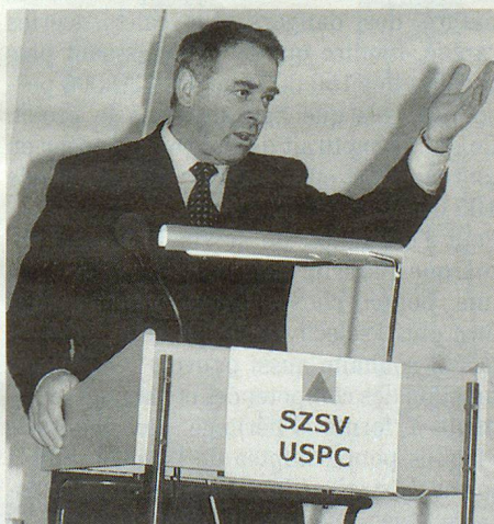
Adolf Ogi: «Je le dis consciemment, à cette occasion et dans ce lieu: La PCi a démontré ses compétences...»