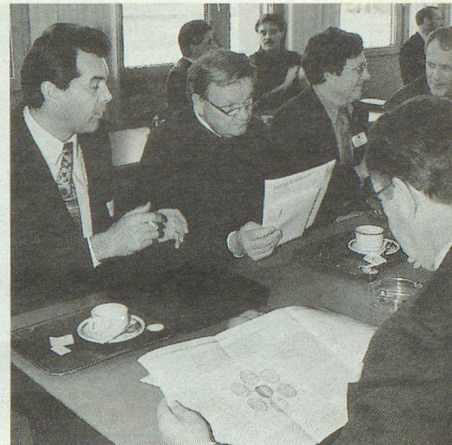
Atmosphère studieuse chez les Valaisans...