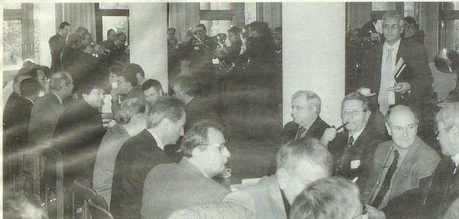
«P'ti déj.» accompagné par la fanfare de la PCi soleuroise.