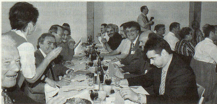
Une table de Romands.

Démonstration magistrale du rôle de la PCi dans le futur projet. Pourtant, le raisonnement reste très «politique» (c'est son rôle), très aristotélicien dans sa «logique», mais crédible: pourquoi pas? Il ne restera qu'à le confirmer dans les faits. ▣