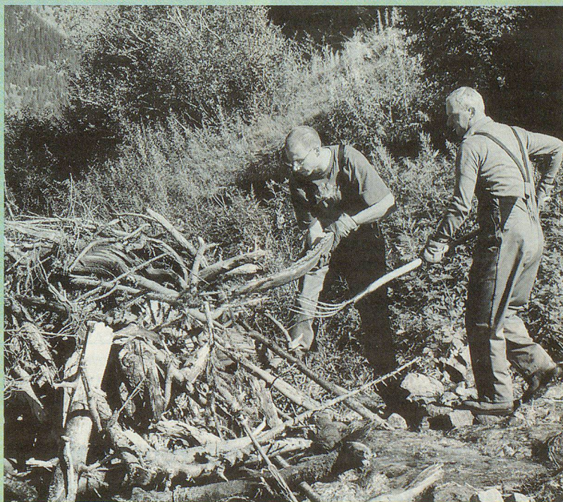
Ein Bild aus besseren Tagen, Schlierener Zivilschützer im solidarischen Hilfseinsatz im Wallis.