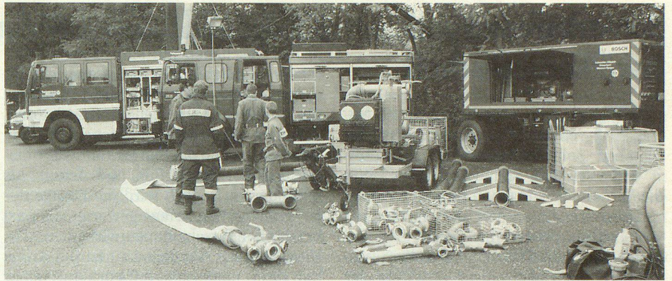
«Auslegeordnung» des THW Waldshut.

Auf dem Einsatzgelände wurden vor grossem Publikum Einsatzübungen von und mit Partnern durchgespielt. Mit dabei waren Formationen des Zivilschutzes und des Technischen Hilfswerkes (THW) Waldshut aus dem benachbarten Deutschland. Auch die Kameradschaftspflege und Geselligkeit kam nicht zu kurz an diesem ereignisreichen Tag. Cabaret, Show und ein heiterer Feuerwehr-Wettkampf gingen über die Bühne.