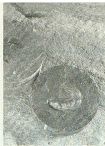
Nagra, Benken ZH: « Leioceras opalinum ».

Fossilfund: 179 Millionen Jahre im Opalinuston eingeschlossener Ammonit.