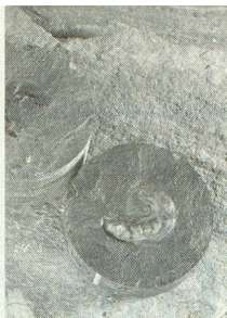
Nagra, Benken ZH: « Leioceras opalinum ».

Fossilfund: 179 Millionen Jahre im Opalinuston eingeschlossener Ammonit.