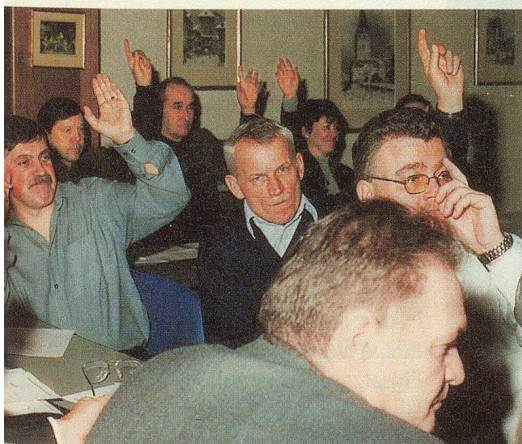
Einhellige Zustimmung zu allen traktandierten Geschäften.

Die Aufgabenteilung im Bereich Rettung werde noch zu Diskussionen führen, prognostizierte Banga. Ihm gehe es jedoch vor allem