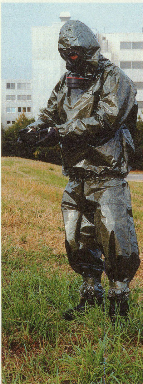
Abito di protezione.

Appurate le lacune, il materiale di radioprotezione è stato conseguentemente migliorato.