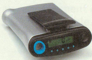
Dosimetro elettronico (EDOS 99).

Test di maneggevolezza e lettura dei dati per i nuovi apparecchi di detezione con sonda.