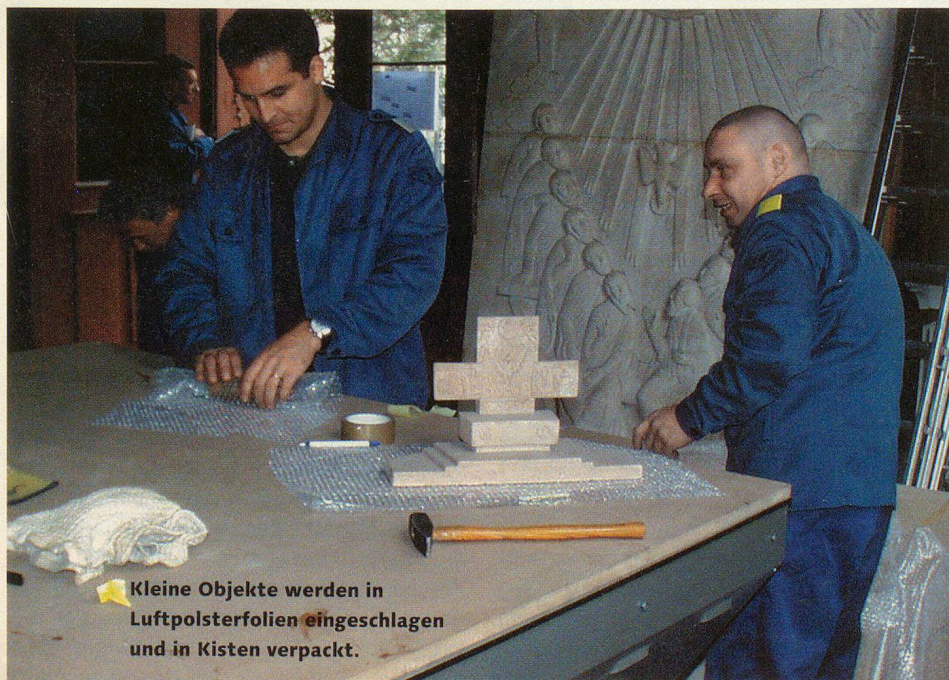
Kleine Objekte werden in Luftpolsterfolien eingeschlagen und in Kisten verpackt.