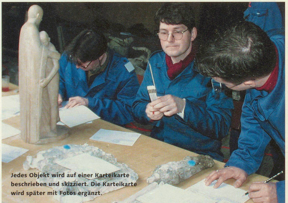
Jedes Objekt wird auf einer Karteikarte beschrieben und skizziert. Die Karteikarte wird später mit Fotos ergänzt.