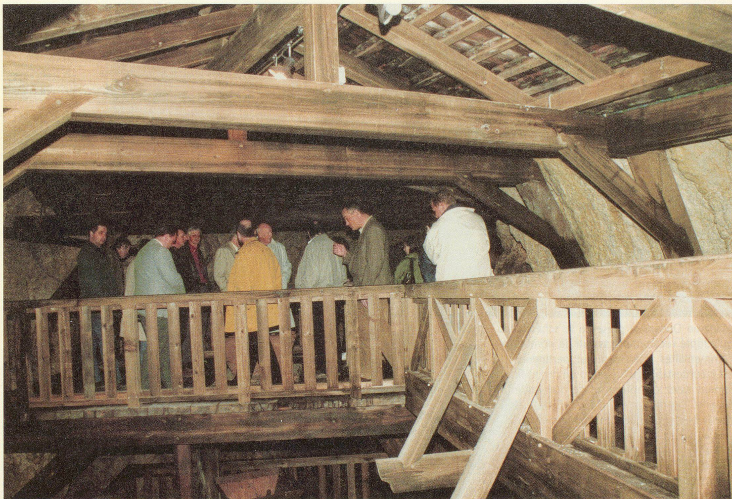
Passerelles et escaliers sécurisés donnent accès quelque 40 m plus bas au cœur des moulins.

ASSEMBLÉE DE LA SECTION NEUCHÂTELOISE AU LOCLE