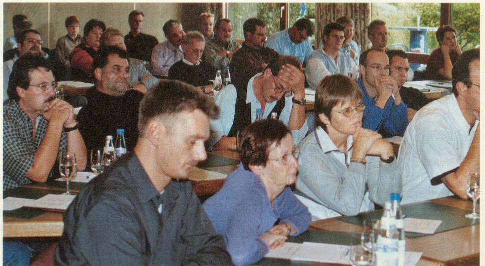
Mit 60 interessierten und mit mitgehenden Teilnehmenden aus dem ganzen Kanton wurde wieder eine glänzende Beteiligung verzeichnet.

Das macht die Aufgabe der Chefs ZSO nicht leichter, sowenig wie die noch nicht