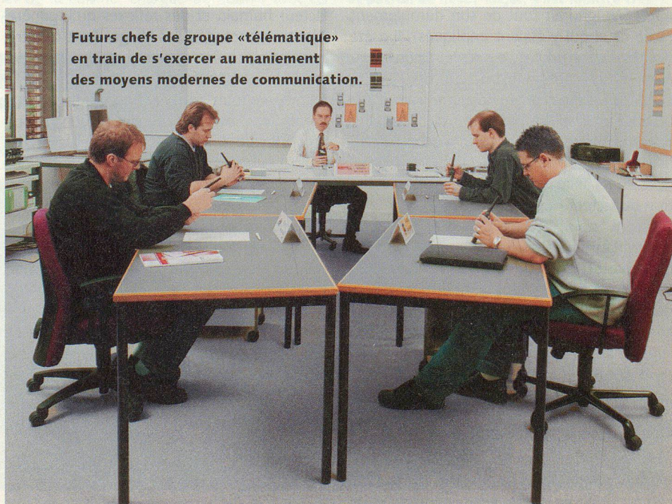
Futurs chefs de groupe «télématique» en train de s'exercer au maniement des moyens modernes de communication.