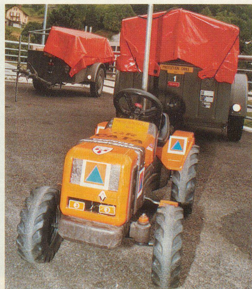
Clin d'œil ou prévision?