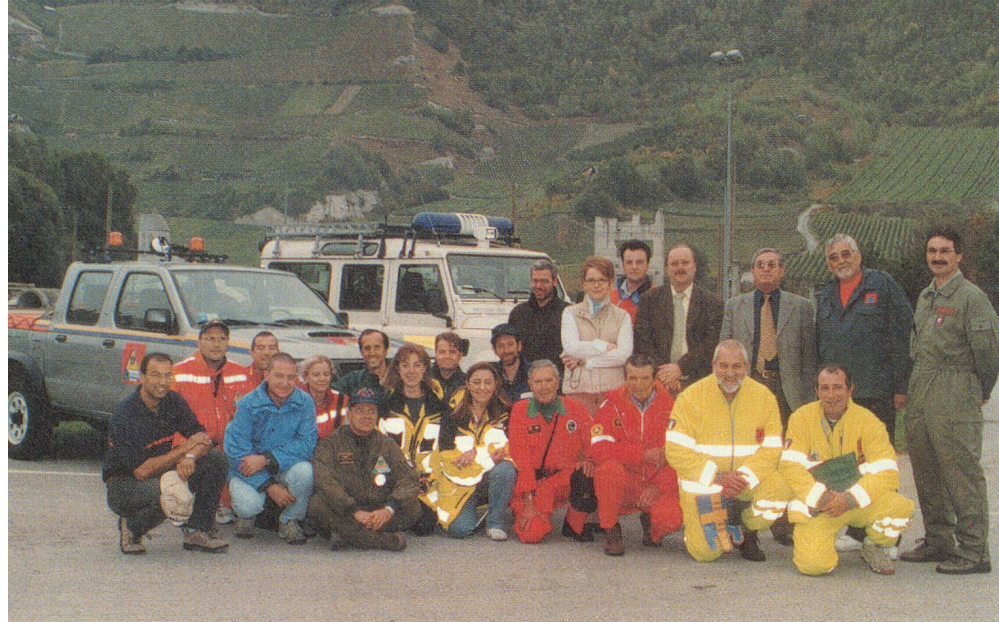
La délégation de la PCI véronaise.