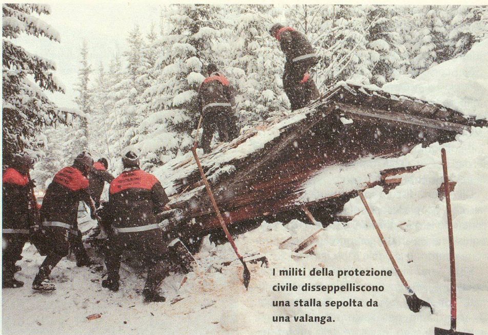
I militi della protezione civile disseppelliscono una stalla sepolta da una valanga.

Vengo convocato al mio primo intervento all'età di ventun anni. Con i miei camerati più anziani partecipiamo ai lavori di ripristino dei danni causati nella nostra regione da una tempesta che ha devastato parte dell'Europa. Sul posto mancano sia i collegamenti radio che i tecnici della trasmissione. Mi presto così bene a svolgere questa funzione che il capo della telematica mi propone di frequentare il corso per capigruppo di quel settore.