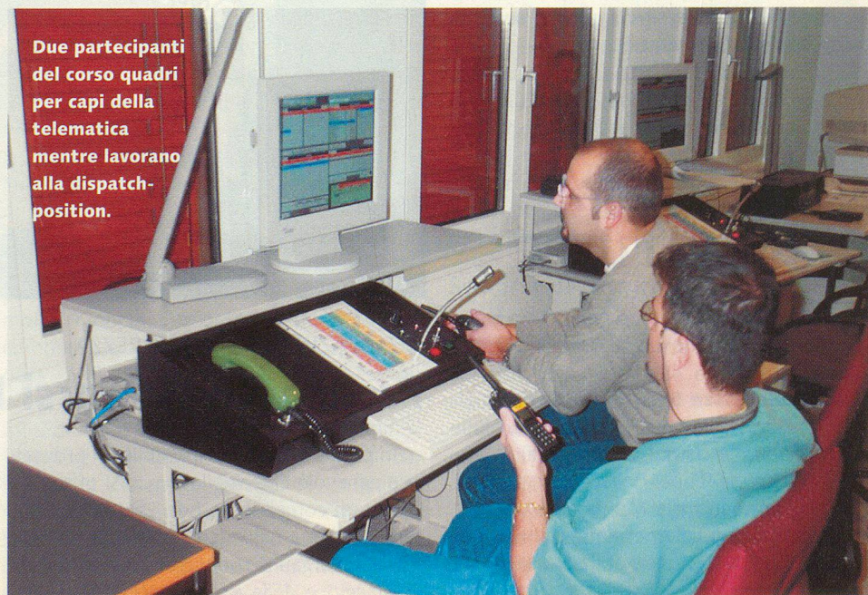
Due partecipanti del corso quadri per capi della telematica mentre lavorano alla dispatch-position.

Nel corso della prima fase mi sottopongono ad una serie di test per stimare lo stato di salute, l'efficienza fisica, le capacità intellettuali e l'idoneità al comando. In collaborazione con le università, vengono poi valutate anche