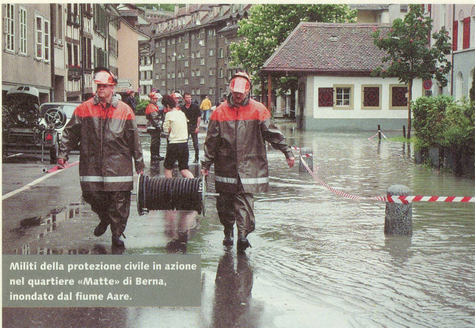
Militi della protezione civile in azione nel quartiere «Matte» di Berna, inondato dal fiume Aare.

Tutti i corsi di ripetizione, indipendentemente dal grado gerarchico dei partecipanti, richiedono molta fantasia per offrire ogni volta un'istruzione molto vicina alla realtà.