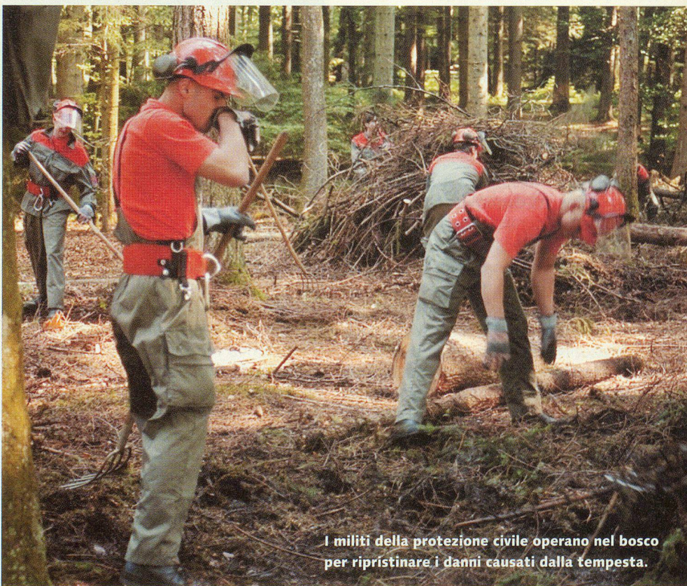
I militi della protezione civile operano nel bosco per ripristinare i danni causati dalla tempesta.

Gli altri documenti raccolti nel classificatore concernono gli interventi a cui partecipo più tardi: un intervento di sostegno di cinque giorni prestato in Vallese, diversi interventi per far fronte alle alluvioni che hanno colpito il Ticino e la città di Berna, la collaborazione ai lavori di ripristino dei danni causati dalle valanghe nei comuni di montagna e gli interventi prestati per una manifestazione cantonale.