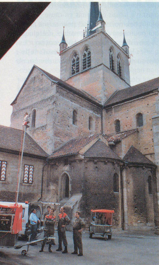
Une exposition PCI à l'ombre de l'abbatiale de Payerne.

En guise de «dessert», le D r Henri Rollier a traité avec sa verve et son sens aigu du détail du nouvel engagement du service de protection atomique et chimique dans le canton de Vaud. Sujet difficile, parce que la conscience de chacun a une tendance quasi inconsciente à rejeter ce type de message, tant les menaces sont à la fois concrètes, par les exemples, et inconcevables pour l'esprit du citoyen lambda. C'est toute la difficulté de la mission du D r Rollier et qui milite bien en faveur de la création d'une coordination cantonale, animée par des spécialistes de ces questions. C'est un minimum. □