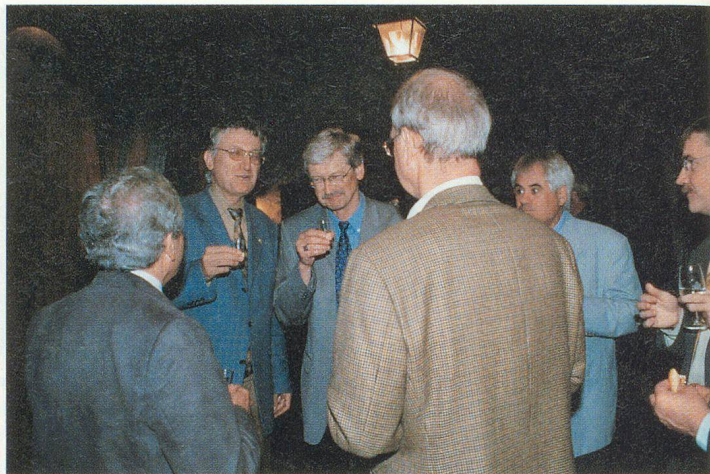
Le moment des confidences (chacun se reconnaîtra).