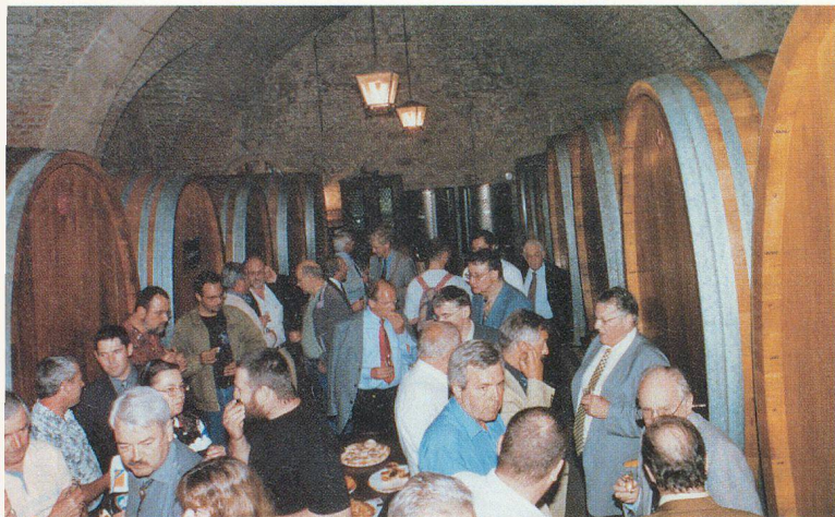
La cave de la Reine Berthe et ses chais impressionnants.