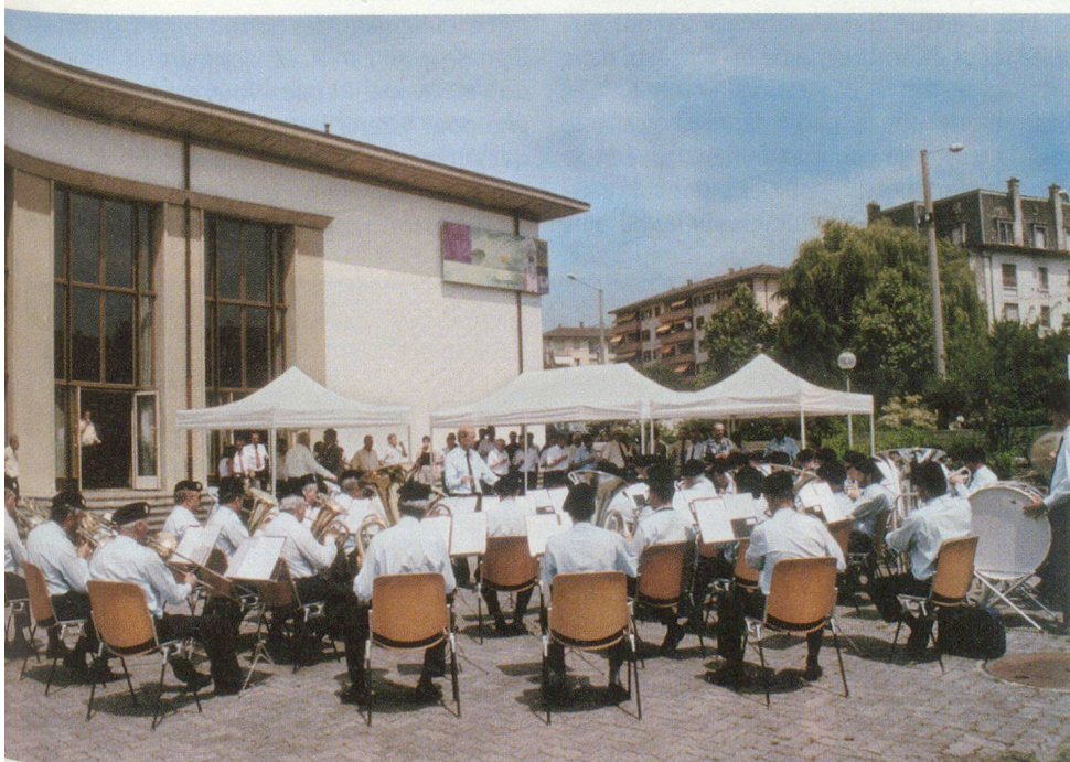
Abade (... et petits-fours) par la fanfare de la PCI cantonale vaudoise.

té du résultat des votations du 18 mai dernier qui donne un nouveau visage à la sécurité dans ce pays. C'est dans cette optique que le canton a organisé des FIR (Forces d'intervention rapide) composées de 1500 hommes et capables d'intervenir dans l'heure. Ce dispositif est complété par les FAR (Forces d'appui régionales), fortes de quelque 6500 hommes, mises sur pied dans les six heures. Cette structure a déjà démontré son efficacité, poursuit Jacques Buchet, notamment dans le cadre du récent Sommet G8. Ce dispositif devrait trouver prochainement un ancrage légal, par le biais d'une nouvelle loi cantonale.