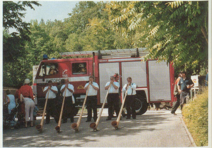
En attendant l'exercice.