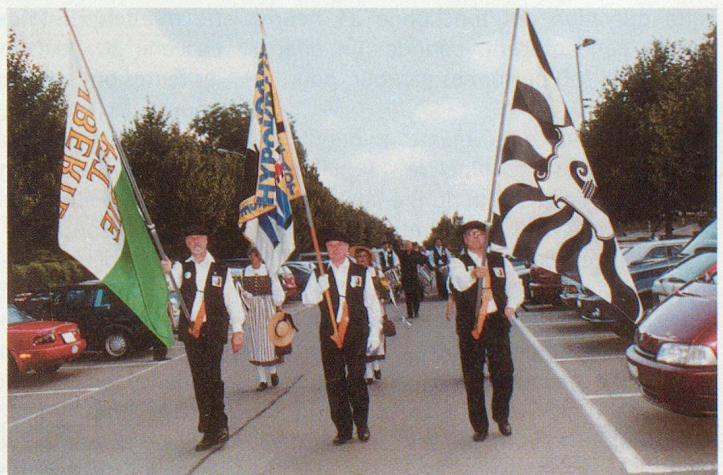
On s'entraîne à défiler.