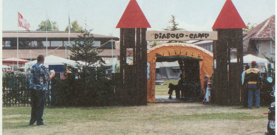
La porte d'entrée du camp.

FÊTE ROMANDE DES TAMBOURS, FIFRES ET CLAIRONS