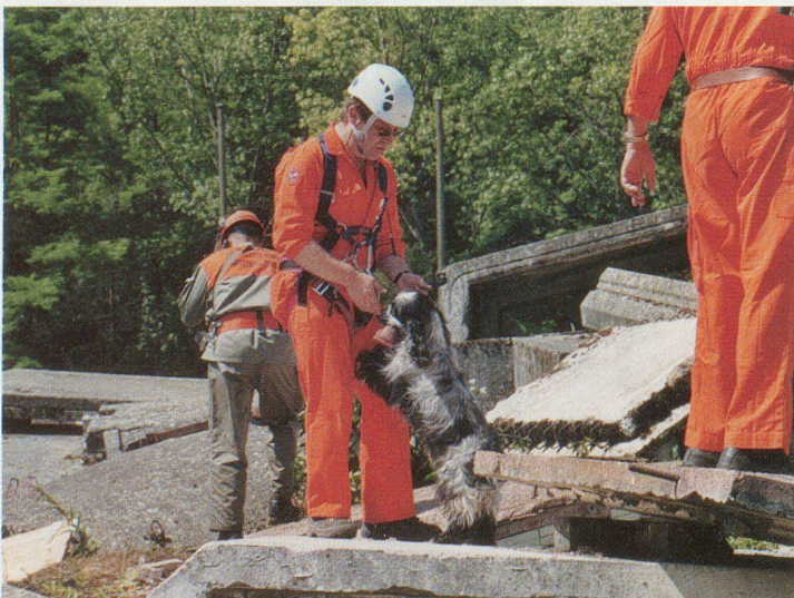
«Pirate» va entrer en action.