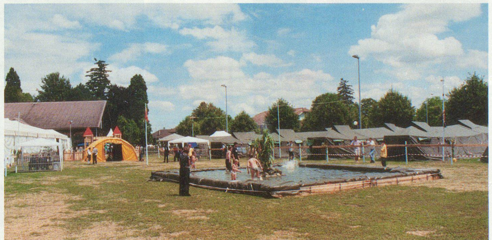
Un bassin pour les enfants.

pour autant de manifestants ne se présente pas tous les jours. C'est l'occasion idéale pour entraîner le commandement et la coordination entre les services, ainsi que la collaboration avec les partenaires. L'exercice en tant que tel a duré trois jours (du 4 au 6 juillet)