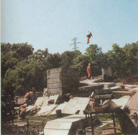
Hélicoptère d'un chien de la Redog.

cette haie, pour rejoindre la porte d'entrée du centre. Il n'est pas inutile de préciser, pour ceux qui l'ignorent, que dès 1896 la Compagnie s'est progressivement organisée en unité militaire, enrichie d'une Musique de marche dès 1969. Forte de 135 hommes, elle défile aux sons des marches lentes napoléoniennes portant haut ses bonnets à poils et ses fusils modèle 1822 Tbis qui ont servi au siège de Sébastopol.