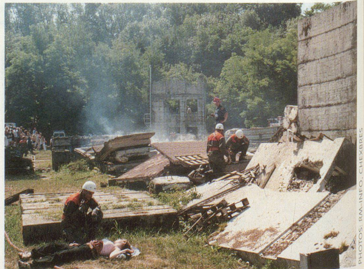
Le détachement Goupil entre en action.