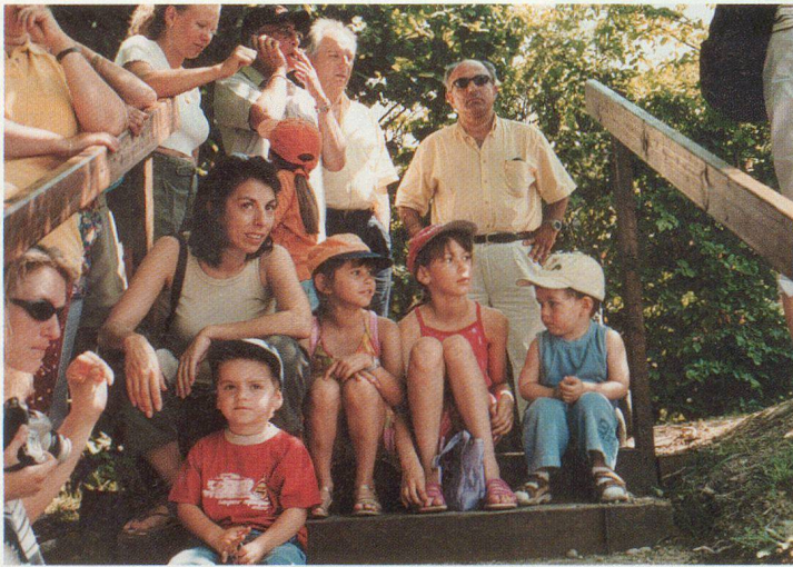
Un public jeune et moins jeune.

Pour accueillir les nombreuses personnalités, suisses et étrangères, une haie d'honneur était constituée par une unité des Vieux-Grenadiers. Quel flegme pour supporter ce magnifique uniforme napoléonien si peu adapté à la température, mais quel succès aussi pour cette vénérable société! Drôle aussi de constater que le citoyen lambda se fauflait derrière