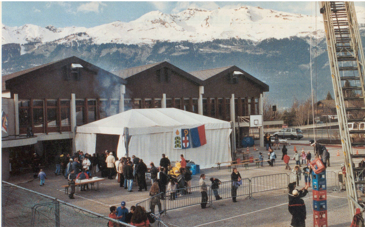
Vue générale de la place du Louché.