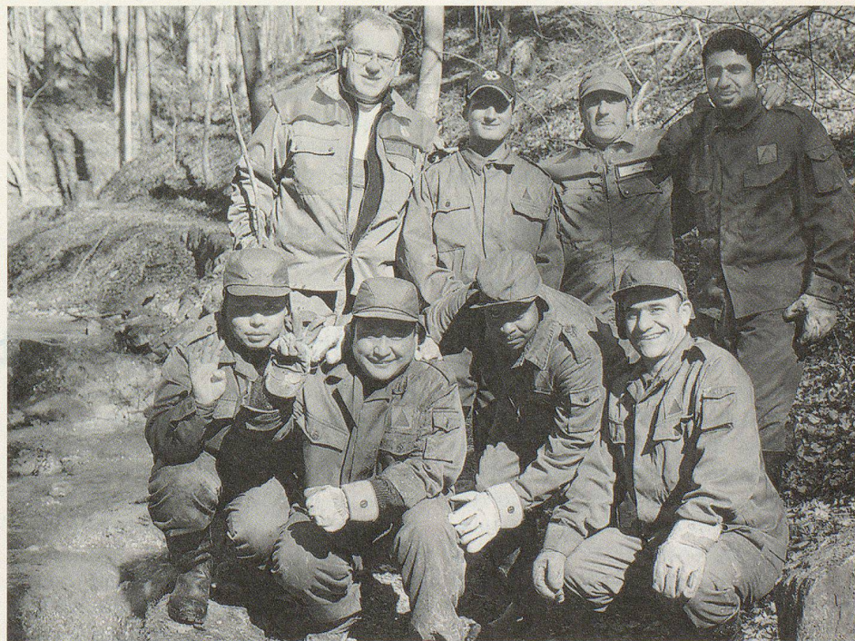
Arbeitspause des Teams von Zivilschützern und Asylsuchenden.