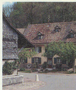
Mühle Oberdorf BL, 16. Jahrhundert.