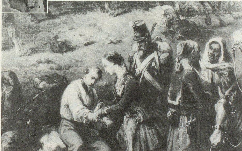
Bataille de Solferino – 24 juin 1859.

«Cette année la Journée mondiale revêt un caractère particulièrement solennel car elle coïncide avec le 175 e anniversaire de la naissance de Henry Dunant. Cet événement est l'occasion de souligner que l'esprit éclairé de l'illustre Genevois a été à l'origine du droit international humanitaire et du mouvement universel d'entraide et de secours qu'est la Croix-Rouge. La guerre en Irak nous rappelle le rôle indispensable et irremplaçable de la Croix-Rouge lors d'un conflit armé, pour protéger les soldats blessés ou prisonniers ainsi