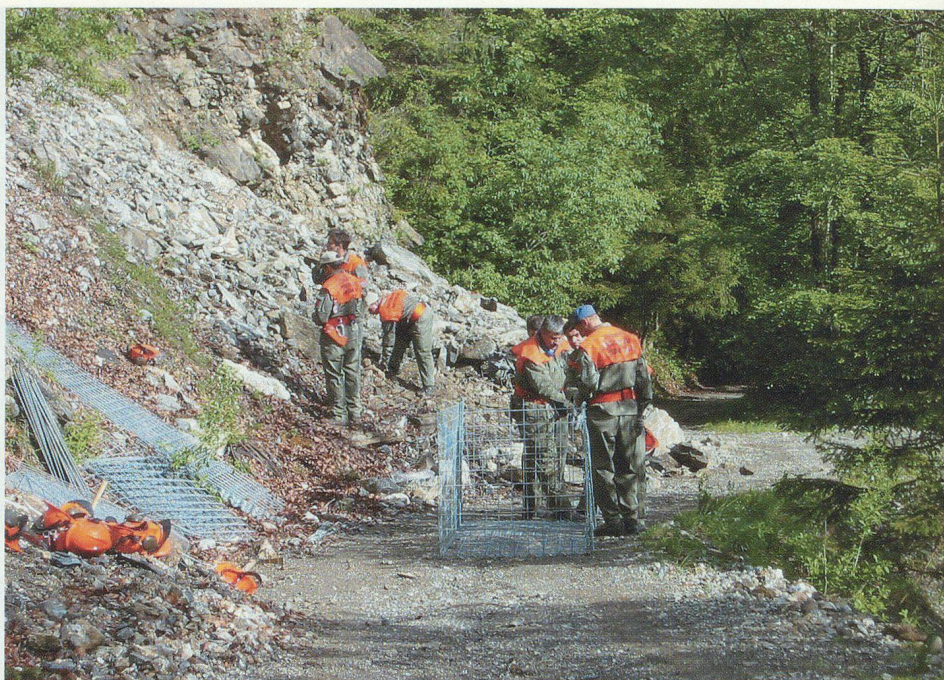
Das Rettungspikett beim Montieren von Steinkörben.

Die Mannschaft des Rettungspiketts war an zwei Orten im Einsatz: Im Gebiet Rübi in der Aaschlucht montierte die erste Gruppe Steinkörbe, um damit die Wanderwege vor Steinschlag zu schützen. Die zweite Gruppe nahm im Gebiet Arnitobel auf beiden Seiten des Weges diverse Ausholungen vor. Die Arbeiten gingen gut und fröhlich voran, so dass die Ziele erreicht werden konnten. Ein Verpflegungs- und Materialzelt diente als «Restaurant» und Materiallager für die Gerätschaften. Zudem schützte es vor dem zwi-